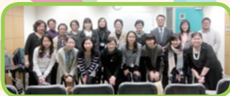
兩校老師彼此進行戲劇教學交流，提昇教學質素。