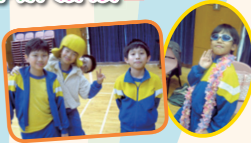
學生能運用道具進行即興創作，動作維妙維肖！

本校中文科及戲劇科的老師於本年度二月七日到九龍慈雲山晉色園主辦可立小學進行戲劇科交流活動，而該校的戲劇老師於三月二十六日亦到訪本校進行戲劇觀課活動。兩校彼此互相觀摩，並藉著研討會進行戲劇科的教學交流，雙方獲益良多！