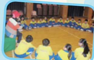
老師以「教師入戲」的方式與學生對話，以提昇學生的反思及判斷能力。