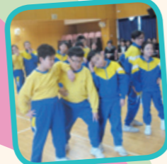
學生的定格姿態多吸引