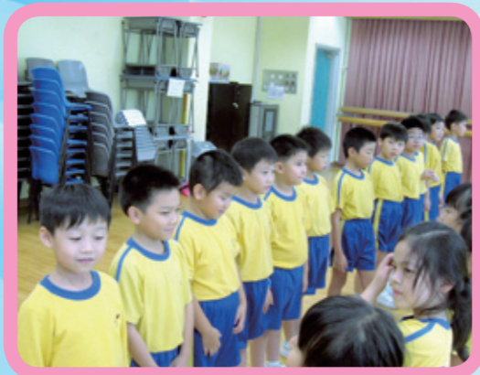
小二學生正在進行形體動作及聲線訓練，表現投入認真。