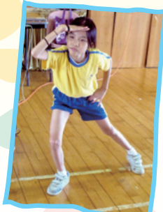
學生能運用不同面部表情及肢體動覺去豐富戲劇情境。