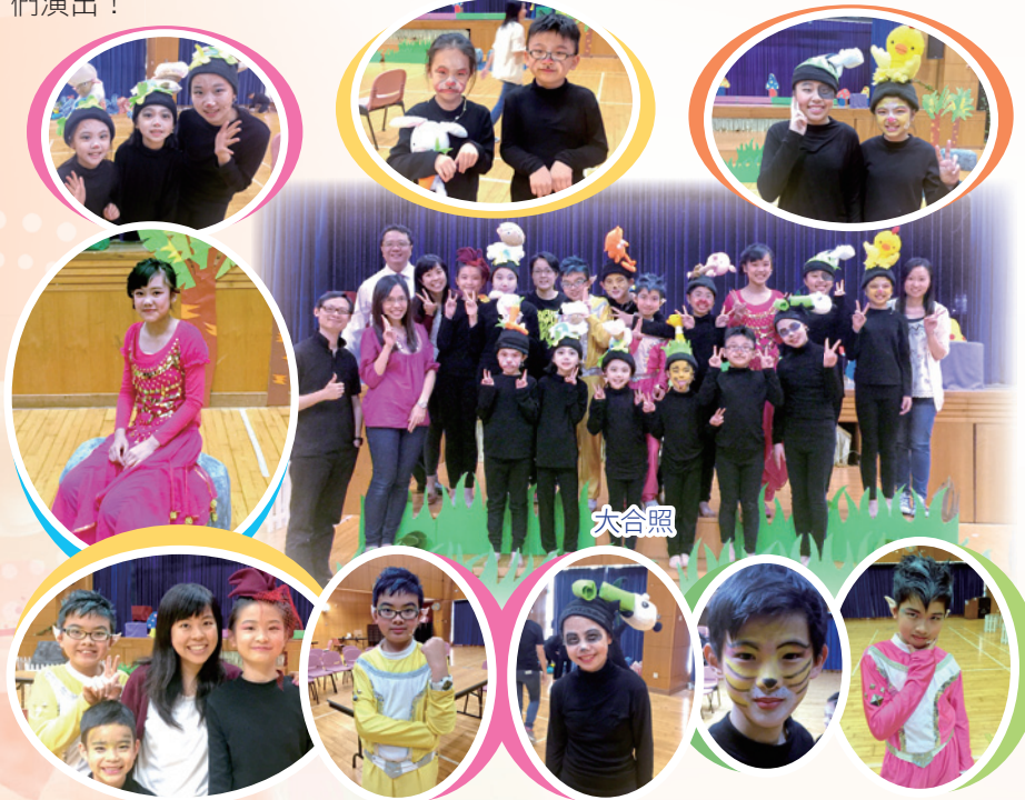
鬼馬的戲劇小組成員，表情趣怪，動作生動有趣！

密切留意！ 第十八屆北區短劇節決賽將於 27/6/2015(六) 晚上 7:30 舉行，有興趣的同學可到城市電腦售票處自行購買門票，支持同學們演出！