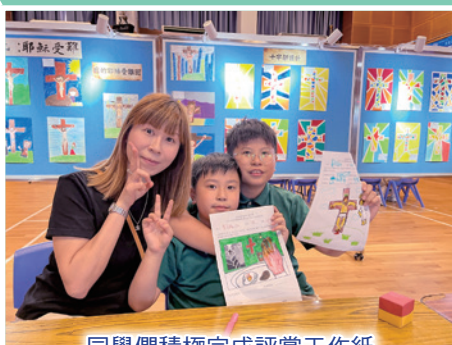
同學們積極完成評賞工作紙