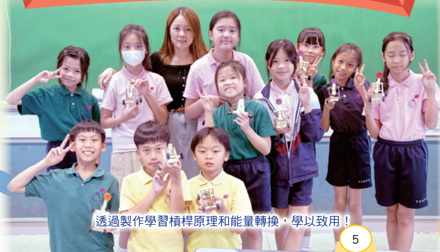
透過製作學習槓桿原理和能量轉換，學以致用！