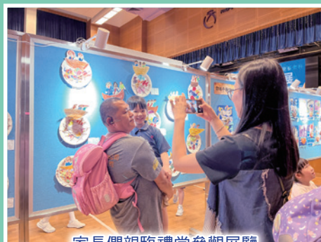
家長們親臨禮堂參觀展覽