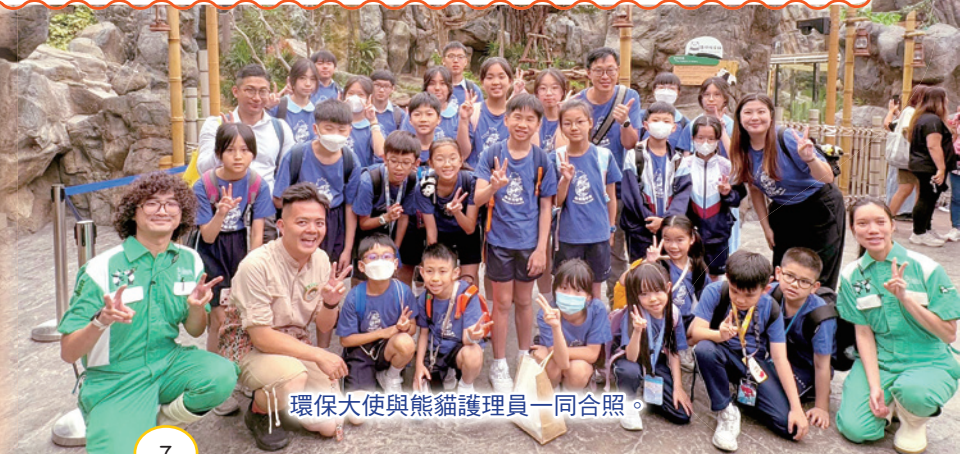
環保大使與熊貓護理員一同合照。