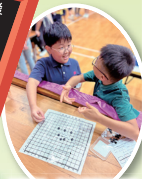
同學們一起分享攤位禮物（黑白棋），智力鬥一番。

「數學聯乘 STEAM」活動旨在透過多元化的學習體驗，激發學生對數學及 STEAM（科學、技術、工程、藝術、數學）的興趣。透過精彩的專題講座、互動攤位遊戲、數學與科學遊蹤，以及動手做的實踐環節，提升學生的學習興趣。攤位遊戲設計新穎，結合數學邏輯與趣味挑戰，讓學生在遊戲及歡笑中學習。數學與科學遊蹤有效培養學生的觀察與探究能力，運用已有知識完成各項任務。兩天的活動成果豐碩，學生不僅提升了對數學的興趣，更體驗到 STEAM 的實用性與趣味性。