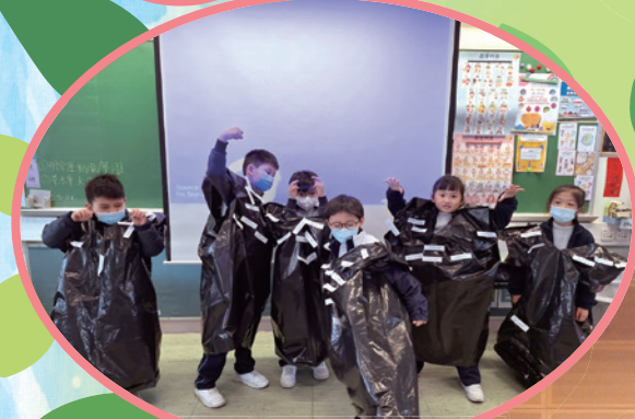
什麼是天父喜愛的好行為呢？

「豐盛生命教育日」在天父的帶領和保守下完滿舉行！同學首先在禮堂參與敬拜，眾師生一同讚美天父，然後有校長帶領禱告揭開序幕。各年級按照不同主題在課室進行不同的活動，例如：蒙眼遊戲、製作五色毛毛蟲、見證分享、製作感恩卡等，同學在當中不只認識真理，更能實踐出來，學做愛神愛人的好孩子。