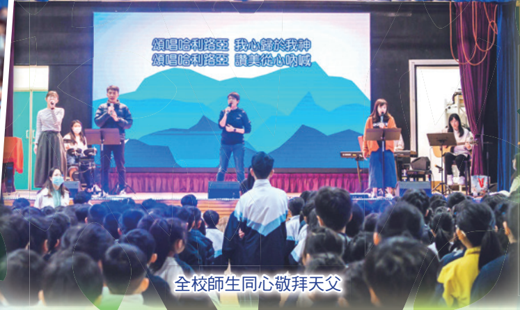
全校師生同心敬拜天父