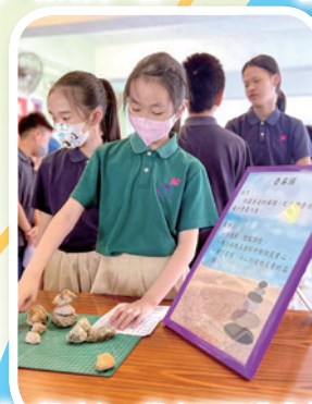
疊石頭，學重心。當中石頭塔或會倒下，但同學仍堅毅再嘗試！