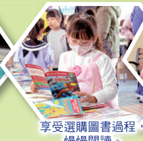
享受選購圖書過程，慢慢閱讀。