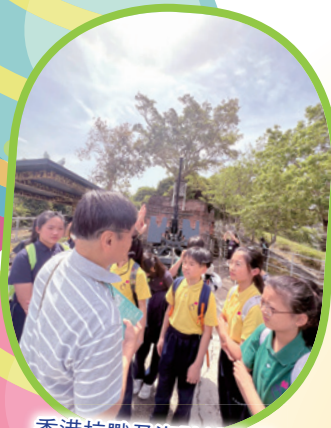
香港抗戰及海防博物館