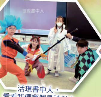
活現書中人，看看我們哪個最神似！