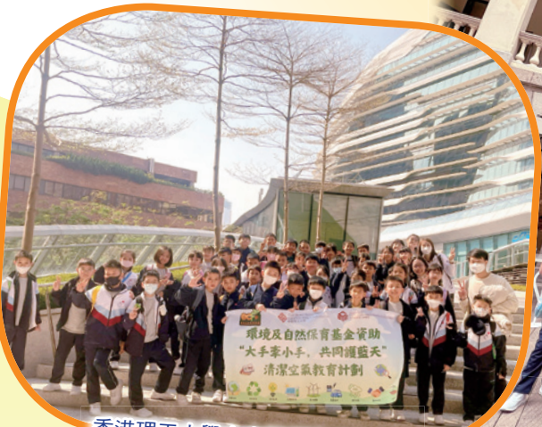
香港理工大學土木及環境工程學系主辦的「清新空氣教育計劃」