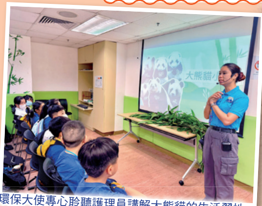
環保大使專心聆聽護理員講解大熊貓的生活習性。

本校環保大使前往了香港海洋公園，展開了一場充實的學習之旅！在活動中，同學們不僅近距離觀察了可愛的大熊貓，了解牠們的生活習性和飲食習慣，更有機會與專業的大熊貓護理員深入交流。透過護理員的講解，環保大使們認識到大熊貓每天需要攝取大量竹子，而牠們的消化系統特點及棲息地保護對維持生態平衡至關重要。同學們不僅學習了熊貓保育的專業知識，更掌握了如何在日常生活中實踐環保理念，例如減少使用一次性塑膠製品、支持可持續發展等。這次活動讓大家深刻體會到保護自然環境的重要性，所有參與的環保大使都決心將所學付諸行動，在校內外積極推動更多環保舉措！