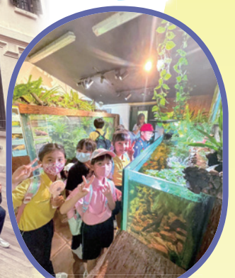
嘉道理農場暨植物園