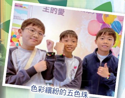
色彩繽紛的五色珠