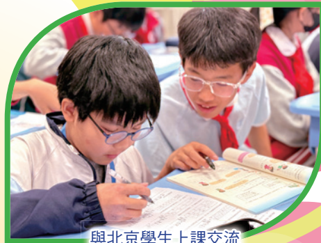
與北京學生上課交流