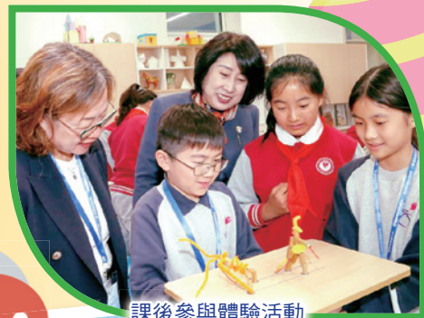
課後參與體驗活動