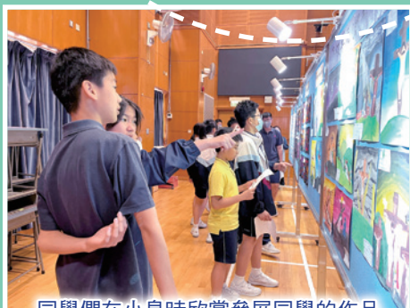
同學們在小息時欣賞參展同學的作品

為期四天的視藝科學生創作展以「宗教藝術」為主題。本次展覽展示了同學們在視藝課堂中的努力，每級學生評賞不同時代的宗教藝術，並進行不同的創作。在展覽期間，學生在老師的帶領下欣賞同學的作品，同時完成有趣的工作紙。衷心感謝校長、老師與家長們到場支持，與同學們現場交流互動，讓整個展覽得以順利進行。