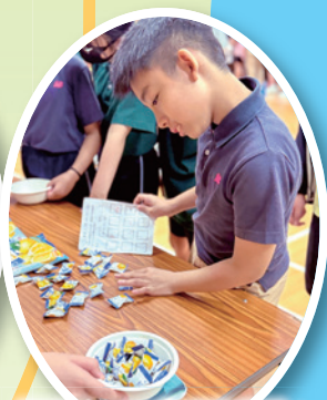
用磅秤 100 克重的糖果，看誰最準！