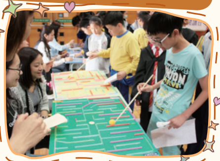
這就是同學最愛的迷宮遊戲。