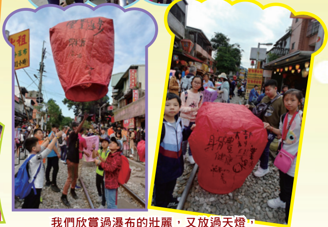
我們欣賞過瀑布的壯麗，又放過天燈，真是很特別的經歷呢！