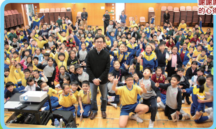
我們全都是厲河先生的粉絲呢！