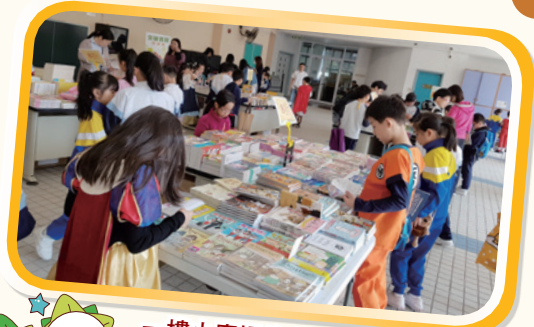
一樓小廣場的書展。