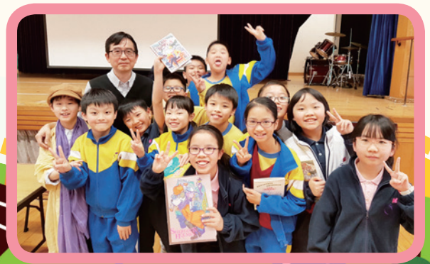
能與自己喜愛的作家合照，真高興啊！