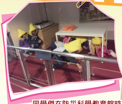
同學們在防災科學教育館時細心聆聽面對天災人禍時的應變措施，並進行了地震及天災模擬體驗。