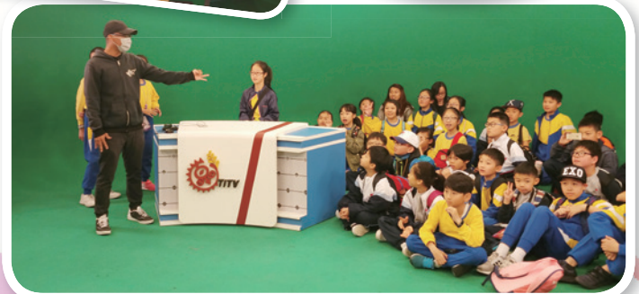
參觀台灣原住民電視台及電台，當電視台小主播，還學了幾句原住民語。