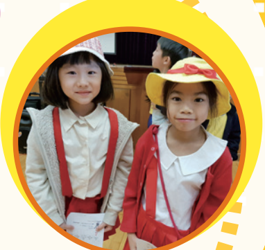
兩個小丸子喜歡閱讀日活動嗎？