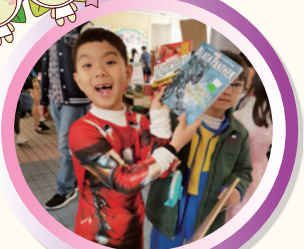
嘩！看我多厲害，買了美國英雄故事書。