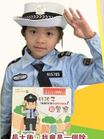
長大後，我會是一個除暴安良的執法者。

閱讀日活動小總結 完結了整天的活動後，你想告訴老師： 原來閱讀活動有用，原可以 讓我們在寫作時想到一些好的題材 還增加我們們的知識呢 我最喜歡的活動是 書展 因為 我們可以買自己喜歡的圖書 我今天裡，學習到 我們應該怎樣閱讀 因為閱讀對我們的幫助很大 而且閱讀一些圖書時，我們要學 會獨立思考。