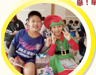
我們的收穫很豐富，看看我們的笑臉就知道我們多喜悅。