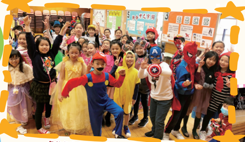
各位各出奇謀，謀殺了……不少「菲林」。