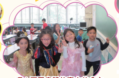
嘩！不同童話故事中的公主都來到我們的課室。