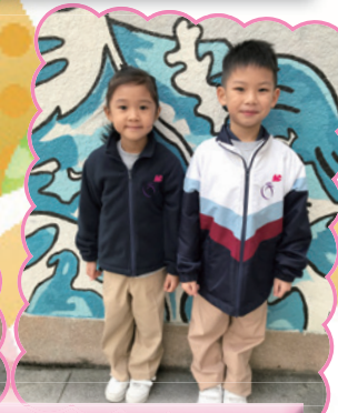
平實的外型，舒適的用料，同學便可輕鬆地上學去。