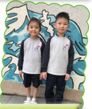
運動服可拼合不同的長短組合，更可在長袖外衣內加入短袖polo恤。做運動感到熱時，便可把長袖外衣脫下，真舒服！