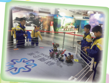
參觀祥儀機器人夢工廠及國立海洋科技博物館，認識了研發和製造機器人的創新工程和相關技術。