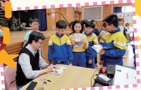
厲河先生為我在書上簽名，真是高興極了！