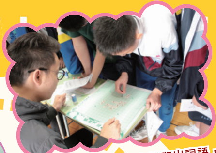
砌！砌！拼！拼！用字粒砌出詞語，看！這位同學聚精會神努力中。