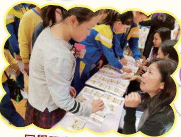
同學玩遊戲，家長義工都替她緊張。