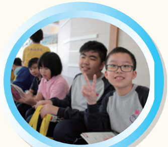
買到不少好書，真開心！