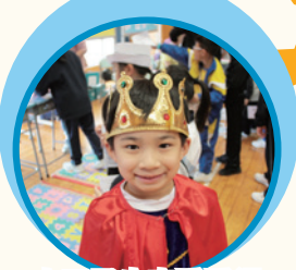
小王子也來看看這個盛大的場面呢！