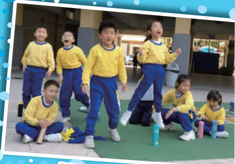
觀眾看得十分投入呢！