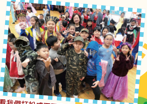
看看我們打扮成不同書中人物，真是唯妙唯肖！