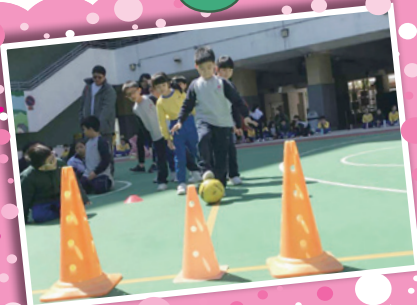
看！小小參賽者的神情多專注！