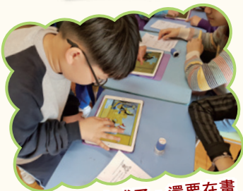
拼砌名畫完成了，還要在畫中找東西，哎，我找到了。