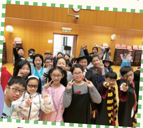
耶！耶！我們最喜歡閱讀日呢！