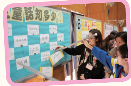
舉！舉！舉！舉起那根棒真費力呢！