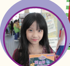
「化妝舞會」我就最喜歡了，你看我扮了誰？