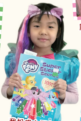
我扮成小馬寶利，大家能看出來嗎？