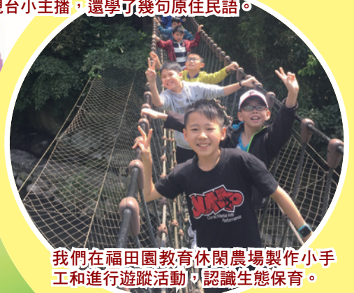
我們在福田園教育休閒農場製作小手工和進行遊蹤活動，認識生態保育。