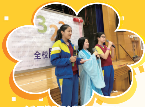
今次司儀的組合真特別，竟然有一個古人主持閱讀日開幕禮。