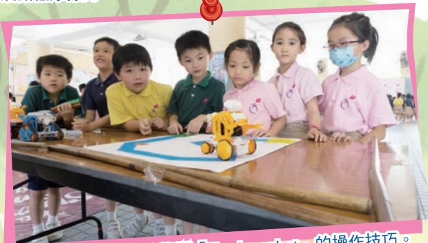
同學們全神貫注地學習「Tamiya robot」的操作技巧。