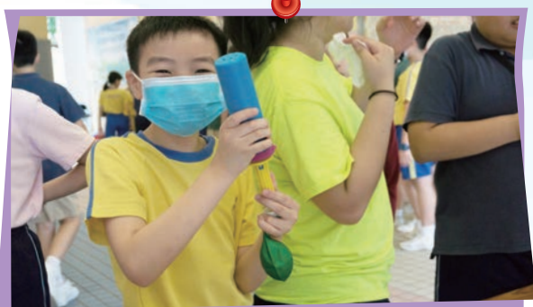
同學們透過參與「氣墊船」攤位活動，學習如何運用空氣減低摩擦力。