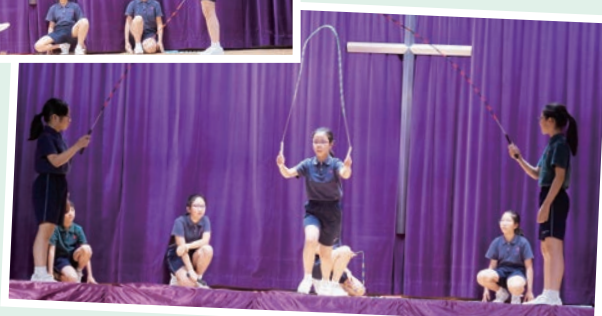
畢業生表演花式跳繩，精彩絕倫。