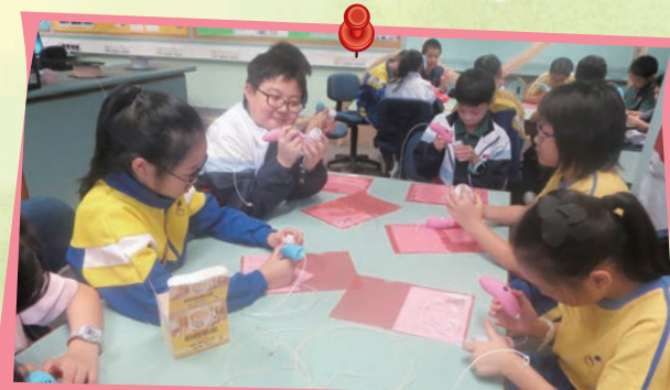
同學們用3D筆製作用具創意的3D作品。