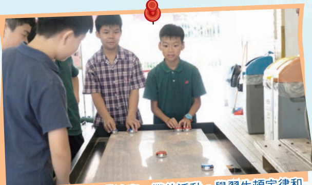
同學們透過參與「沙壺」攤位活動，學習牛頓定律和摩擦力等科學原理。