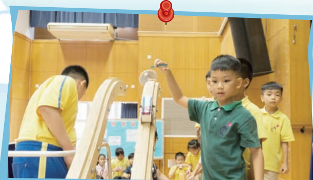
同學們把轆轤車放在長長的路軌上試行，然後根據測試結果再進行改良，務求達致完善。