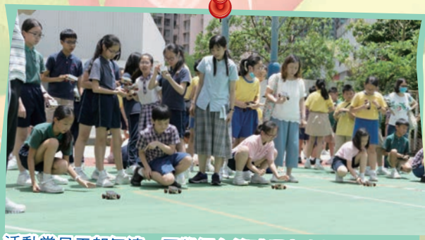
活動當日天朗氣清，同學們在籃球場上盡情享受測試太陽能車的樂趣。