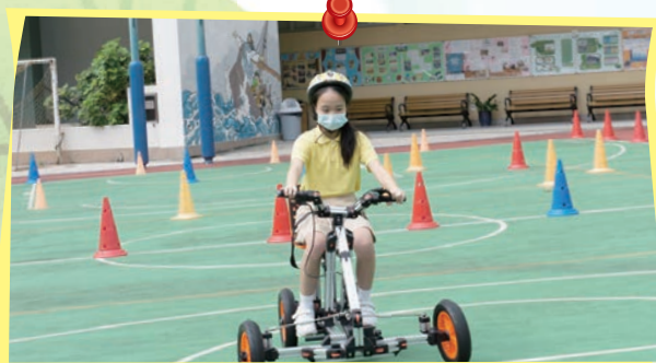
此電動車由STEM資優組的同學製作而成，高年級的同學透過電動車試行體驗活動，分享STEM資優組同學的學習成果。